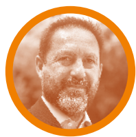
Àngel Puyol Catedràtic d'Ètica a la UAB i actualment director del departament de Filosofia de la mateixa universitat.