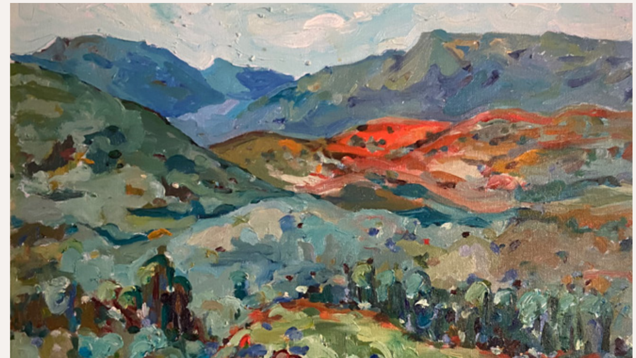
Paisatge de Trévez (Màlaga), obra de Josep Maria Forcada, l'autor del text.

interessa més la figura religiosa esquemàtica, però el paisatge no el trobem plenament si no és adornant escenes humanes o històriques com un afegit de segon pla. En els gravats monocolors és més freqüent l'aparició dels paisatges.