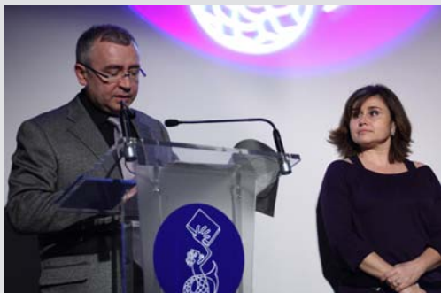
Imatge de l'entrega de la primera edició dels Premis Proteus d'Ètica, celebrada el 10 de desembre al Museu Marítim de Barcelona.

Un bon dia, el correu electrònic de Valors va rebre una notícia sorprenent: l'associació cultural Valors editora de la revista estava nominada a la I edició dels premis Proteus d'Ètica, instituïts per l'editorial que porta el mateix nom, en la categoria de projecte pedagògic. L'entrega dels premis es feia efectiva el passat 10 de desembre en una cerimònia profunda i llúida com no podia ser d'una altra manera. Finalment, els guanyadors dels primers Proteus van ser com a personalitat de l'any i a títol pòstum Vicenç Ferrer, com a entitat d'Economia social Coop57, com a projecte pedagògic l'Escola Cintra i com a mitjà de comunicació o peça periodística la sèrie de reportatges Testigos del Horror , editats per El País Semanal . La veritat és que, davant aquests oponents, els representants de l'associació que vam assistir a la gala vam quedar més que afalagats per haver estat seleccionats en el marc d'aquest guardons. I sobretot perquè una iniciativa modesta com la que vam iniciar ara farà set anys a Mataró buscant aquells valors que ens poden unir a una majoria de ciutadans que volem viure la vida amb sentit ha arribat a ser considerada en alguns àmbits intel·lectuals de la gran ciutat, que sempre es mostra tan ufana amb tot allò que no neix sota la seva protecció o de les poblacions limítrofes. J.S. ■