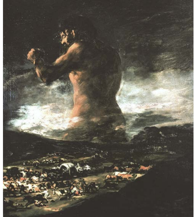
'El coloso', fins fa dos anys coneguda com a obra de Goya i ara atribuïda a Asensio Julià.

L'art és la real comunicació de l'artista en el que pertoca a les seves sensacions i emocions. A més és una comunicació establerta sota uns codis personals, que configuren allò que en diem "idioma artístic" de l'autor. És aquí, en aquesta conjunció perfecta i equilibrada d'elements personals (contingut) expressats de manera tècnicament acurada i en l'idioma plàstic personal (continent), on rau la veritable autenticitat d'una obra d'art.