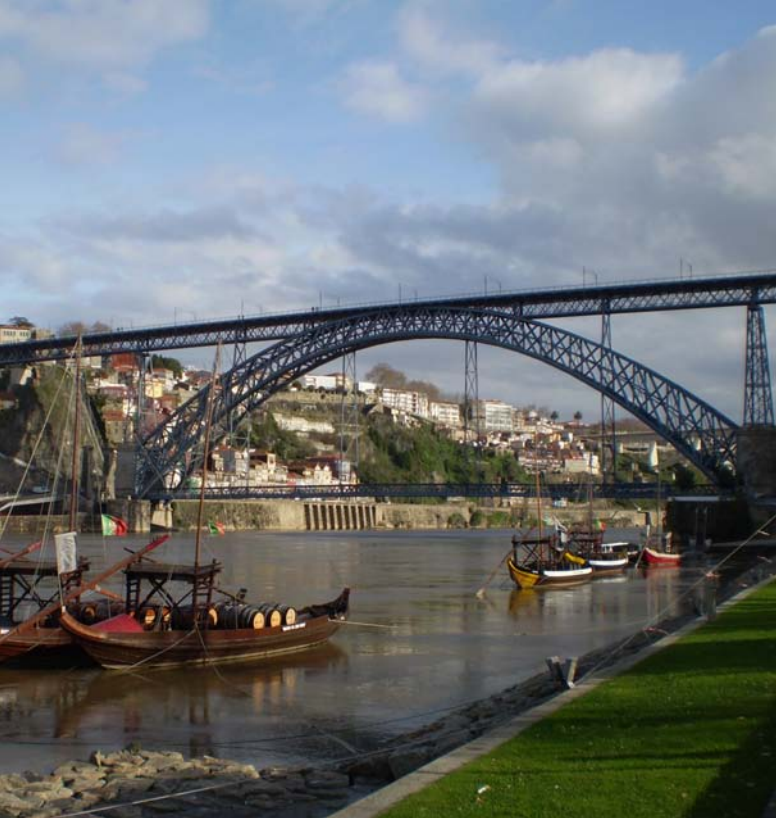
El pont de ferro construït per Eiffel a Oporto, sobre el riu Duero. A sota, l'elevador de Santa Justa, que connecta l'Eixample de Lisboa amb el Bairro Alto.