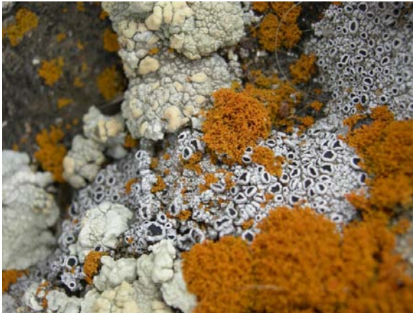
Exemple de líquens crustacis, adherits al substrat"