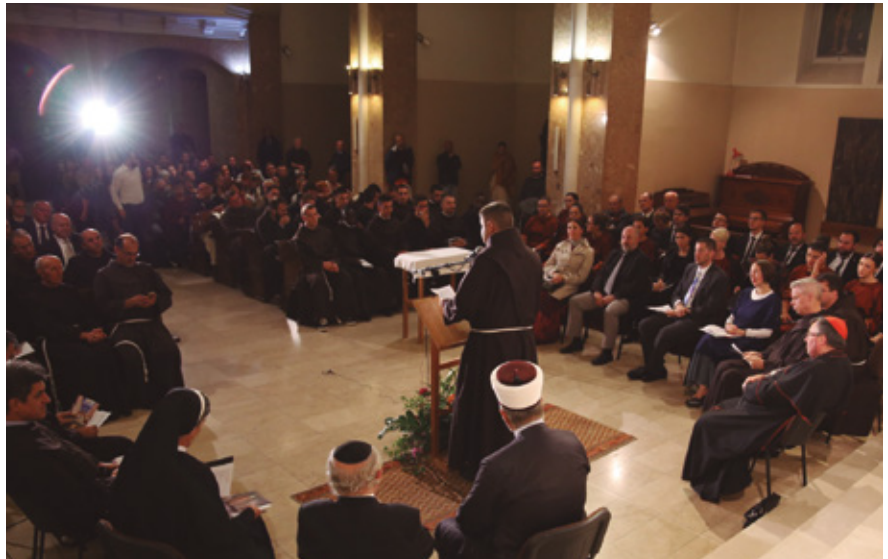
Encontre interreligiós en una església de Bistrik, a Sarajevo (Bòsnia), el 2018.

A Libèria, el Consell Interreligiós del país (RfP-IRCL) va fer de mediador per posar fi a la Primera Guerra Civil de l'estat africà, que va tenir lloc durant la darrera