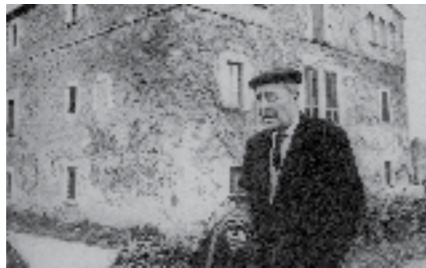
L'escriptor Josep Pla.

La nostra generació, penso que per fortuna, té l'oportunitat de poder llegir a Pla sense ser suspecte de res. I pot valorar Espriu en la seva colossal mesura i admirar-lo alhora que s'admira a Sagarra, a Riba, a Carner, a Foix, a Màrius Torres o a Salvat-Papasseit. O pot dir, sense embuts i sense haver de demanar perdó, que Incerta glòria és la gran novel·la defi-