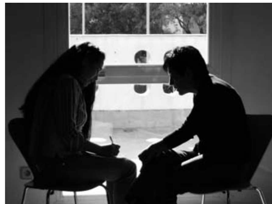
Imatge d'un curs organitzat per la Xarxa Valors a les entitats de la ciutat l'1 de desembre passat.

Crear tallers adaptats a les necessitats dels diferents membres de la Xarxa, dones, veïns, etc. Aprofitar les experiències dels propis membres perquè la formació els sigui més propera, els fas participis i propers a les diferents realitats que hi ha a la ciutat. Realització de tallers de dones.