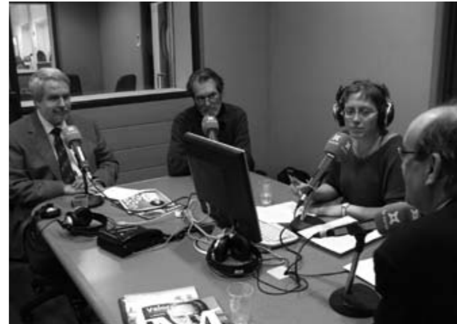
Un moment de la tertúlia sobre l'austeritat en el programa "Valors a l'alça".