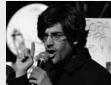
El protagonista.

Quan estudiava a la Universitat de Harvard, va utilitzar el seu accés a l'editorial acadèmica JSTOR per descarregar quatre milions d'articles i repartir-los gratuïtament a la xarxa. Harvard li va suspendre l'accés, però se'n va anar al campus del MIT i va descarregar els articles manualment. Swartz volia posar el coneixement a l'abast de tothom i criticava que els diners que JSTOR cobrava per poder