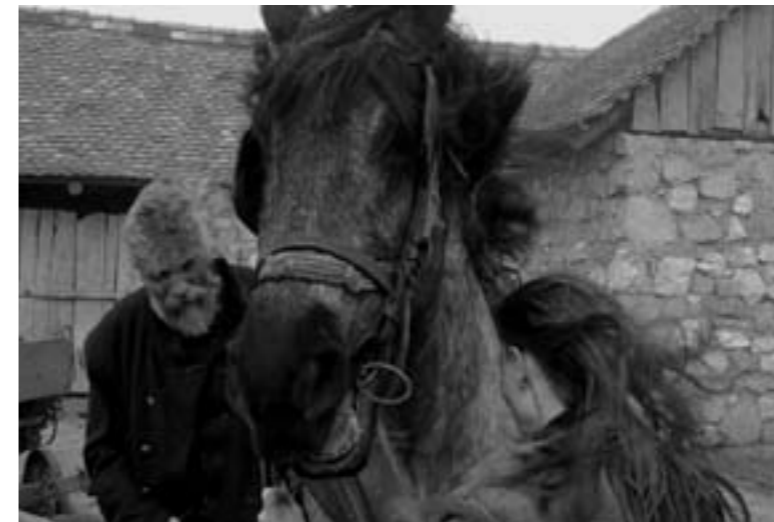
Fotograma de la pel·lícula El Caballo de Turín .

El caballo de Turín (Turin Horse) és una pel·lícula austera que parla sobre l'austeritat. A partir de l'episodi que va marcar la fi de la trajectòria de Friedrich Nietzsche, el director hongarès Bela Tarr ha rodat una pel·lícula que des d'una radical economia de mitjans narratius i de forma clarament al·legòrica ens alerta de la progressiva degradació i decadència del món i els seus habitants. El 3 de gener de 1889, a Turín, Nietzsche es va abraçar plorant a un cavall esgotat i maltractat pel seu cotxer. Després d'aquest episodi, el filòsof alemany va deixar d'escriure per caure en el mutisme i la bogeria. Tarr segueix amb la seva càmera el cavall i el seu conductor, per mostrar-nos a través de la seva asfixiant rutina quotidiana els petits indicis d'una inefable decadència. La pel·lícula està rodada en blanc i negre, i consta d'una trentena de plans i molts menys diàlegs, la majoria dels quals reincideixen de forma repetitiva en mostrat el mode de vida auster d'un pare i una