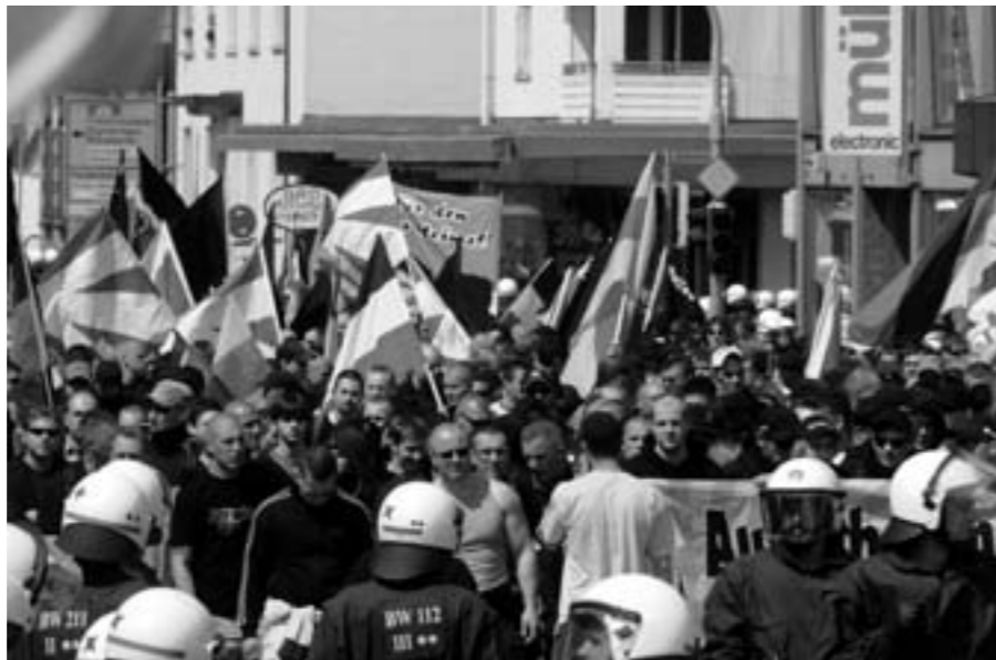
Manifestació del NPD a Alemanya amb els manifestants protegits per la policia.

D'aquesta efemèride, lamentablement, alguns grups reduïts de nazis encara n'han fet festa. El 12 de gener a la ciutat de Magdeburg, ha tingut lloc una marxa neonazi autoritzada en memòria de les víctimes dels bombardejos aliats i de glorificació al feixisme alemany, organitzada per simpatitzants del Tercer Reich i del Partit Nacional Democràtic Alemany (NPD), formació d'extrema dreta, racista i antisemita. Aquest partit existeix al país germànic des de 1964 i el 2010 va ser subvencionat amb 1,2 milions d'euros de l'Estat. Té tretze diputats en els parlaments regionals de Mecklenburgo i Saxònia-Anhalt i tres-cents regidors. El 2003 aquest partit es va intentar il·legalitzar sense èxit i ara moltes organitzacions demanen tornar-hi. Però per què el govern d'Angela Merkel no s'atreveix? Segons la legislació germànica la il·legalització d'un formació d'aquest tipus suposa un procés de dos anys i durant aquest temps, com a